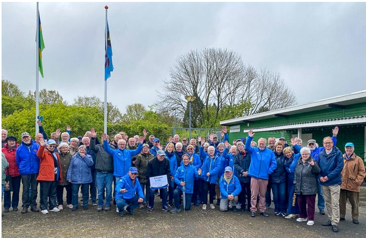
De leden van Lelystad poseren voor de nieuwe vlaggenmasten.