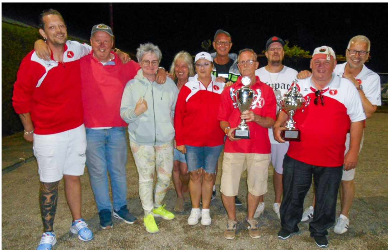
De Gooiers uit Nieuw-Loosdrecht, winnaar van het verenigingsklassement.

deelnemende verenigingen bedroeg acht, drie minder dan het vorige jaar. De complete eindstanden zijn HIER te downloaden.