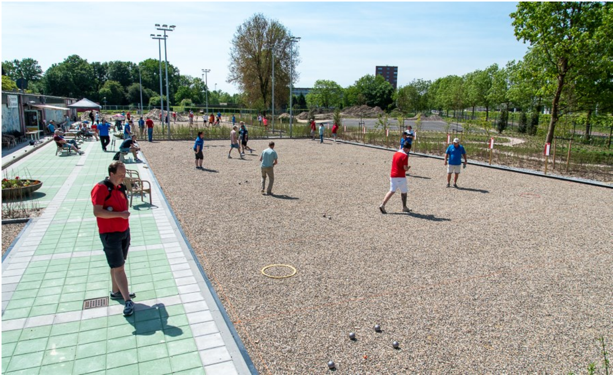
Het net op tijd gereed gekomen nieuwe speelterrein tijdens het DK tête-à-tête op 12 mei jl.

Henk: 'Ik ben pas kort lid hier en ken de oude situatie niet zo goed als Arie, maar alles heeft uiteraard zijn tijd nodig. Maar ik moet wel zeggen dat het er desondanks toch heel fraai uitziet. Jaren geleden zou dit niet gekund hebben. Als club zijn we er blij mee.'