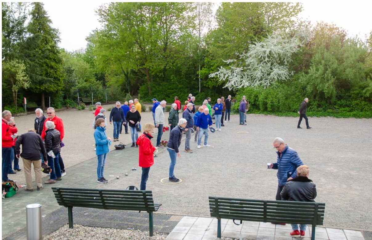
Het buitenterrein van JBC Randenboek tijdens een Zomeravondclubontmoeting in het voorjaar van 2022.

Arie Buis: 'Ook toen was alles nog kaal en hebben we zelf het omringende groen moeten aanbrengen. Na bijna 35 jaar was alles volgroeid met als resultaat een heel aangename speelomgeving.'