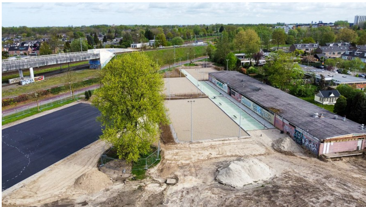
De herinrichting kort vóór het DK tête-a-tête. Links het handbalveld, op de voorgrond komen de tennisbanen en rechts de kantine en de kleedruimten voor het tennis en het handbal. Op de achtergrond links het spoorviaduct.

Eerste prioriteit had de aanleg van het nieuwe speelterrein. De deadline was 12 mei jl., Randenbroek had zich immers een jaar geleden kandidaat gesteld voor de organisatie van het districtskampioenschap tête-a-tête. Eind maart kon gestart worden met de werkzaamheden: het verwijderen van het bestaande groen, de aanleg van de nieuwe terreinen en een nieuw terras en, niet te vergeten, de aanleg van een compleet nieuwe buitenverlichting. Tot ieders opluchting bleken de werkzaamheden op tijd klaar en kon er op 12 mei gespeeld worden. Fase 1 van de herinrichting was geslaagd.